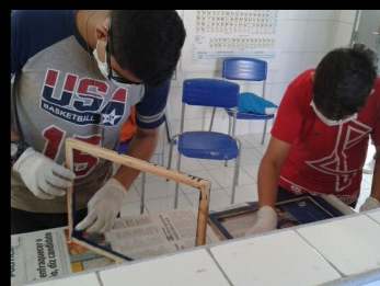
PROJETO VIDA VERDE NA ESCOLA