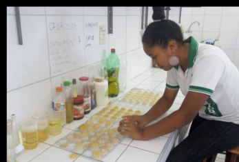
PROJETO BOLINHA DE SABÃO