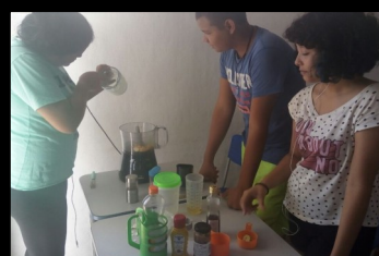
PROJETO QUÍMICA NA COZINHA